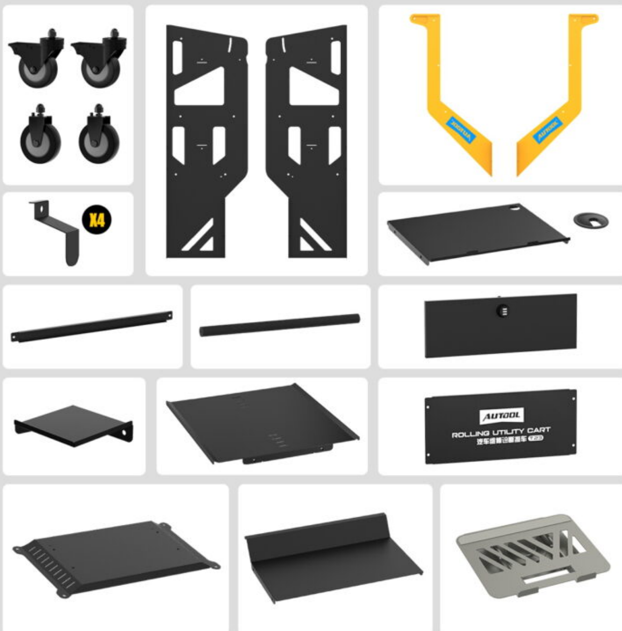
Okvir kolica T23 | 360° rotirajući stalak | 4-inčni tihi točkovi | Sigurnosni kaiš za opremu | Bočne kuke za kablove | Set vijaka za montažu | Uputstvo za montažu | Fioka sa bravom